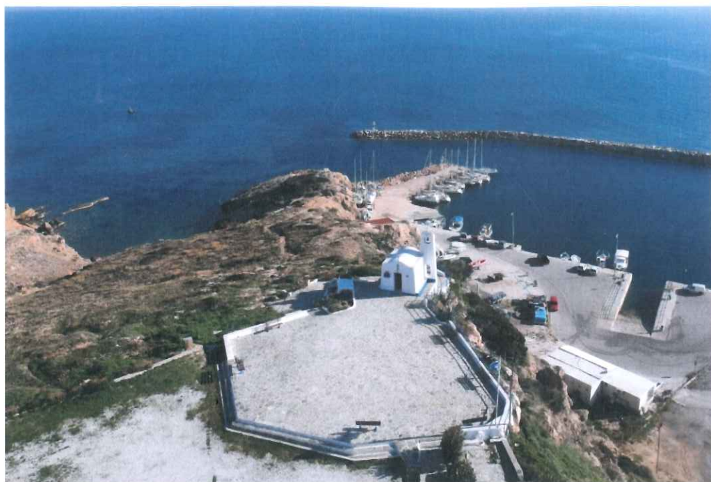
Φωτ. 4.1: Πανοραμική άποψη περιοχής Αγίου Νικολάου