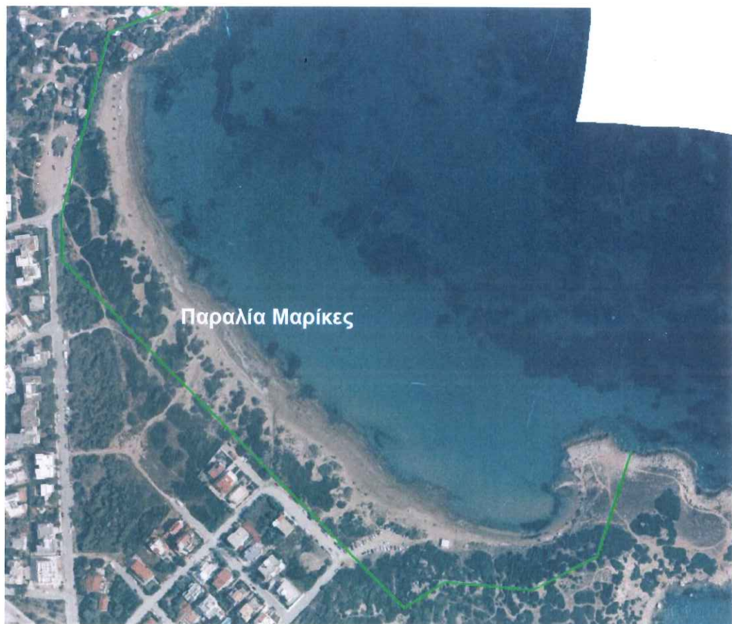
Σχήμα 3.5: Παραλία «Μαρίκες» και όριο Χερσαίας Ζώνης Λιμένα Ραφήνας (Υπόβαθρο Ε.Κ.ΧΑ. Α.Ε.)

Η παραλία εκτείνεται σε μήκος 650m περίπου, με την κύρια χρήση να είναι η πλαζ λουομένων, ενώ όπισθεν της παραλίας υπάρχουν κατοικίες, κύριες και παραθεριστικές, καθώς και δενδρώδεις εκτάσεις.