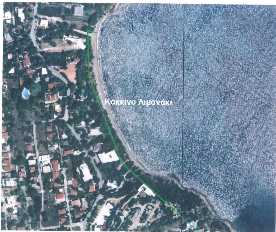
Σχήμα 3.2: Παραλία «Κόκκινο Λιμανάκι» και όριο Χερσαίας Ζώνης Λιμένα Ραφήνας (Υπόβαθρο Ε.Κ.Χ.Α. Α.Ε.)

Η παραλία εκτείνεται σε μήκος 350m περίπου, με τα 300m αυτής να βρίσκονται εντός της Χερσαίας Ζώνης του Λιμένα Ραφήνας. Η κύρια χρήση είναι η πλαζ λουομένων, ενώ όπισθεν της παραλίας υπάρχουν κατοικίες, κύριες και παραθεριστικές.