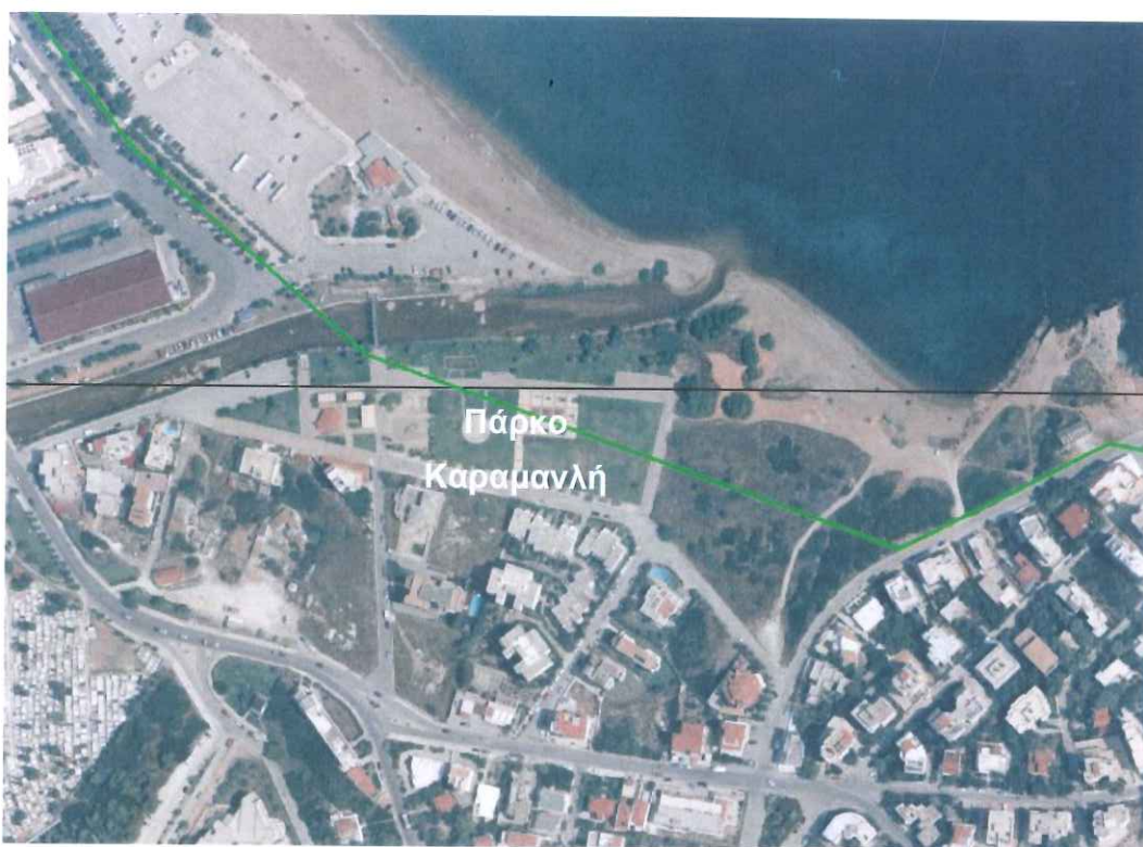
Σχήμα 3.4: «Πάρκο Καραμανλή» και όριο Χερσαίας Ζώνης Λιμένα Ραφήνας (Υπόβαθρο Ε.Κ.ΧΑ. Α.Ε.)

Πιο συγκεκριμένα, η έκταση που καταλαμβάνει το πάρκο ανέρχεται σε 12 στρέμματα περίπου, με τα 3,7 στρέμματα περίπου να βρίσκονται εντός της Χερσαίας Ζώνης του λιμένα.