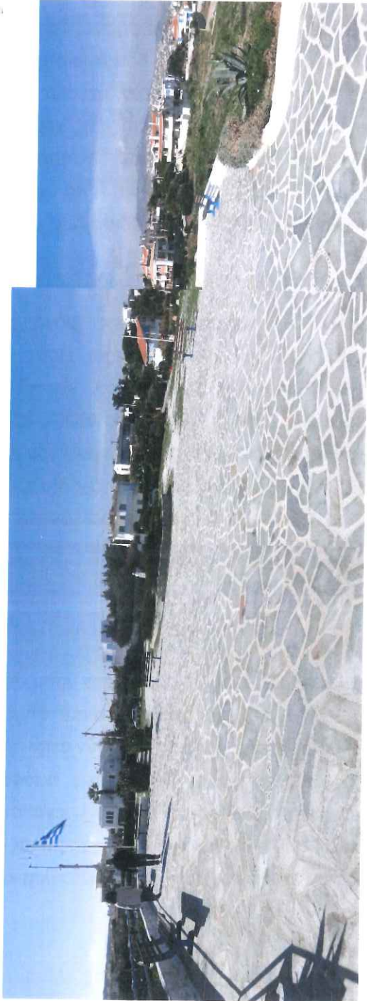
Φωτ. 4.3: Άποψη πλατείας Αγίου Νικολάου