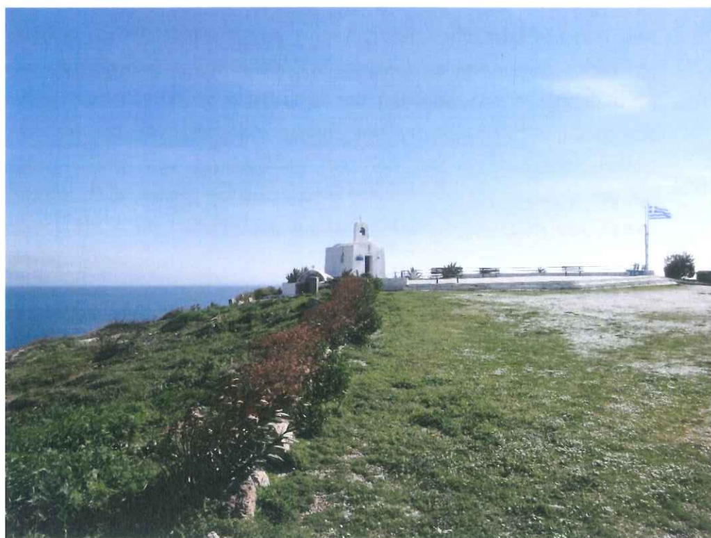
Φωτ. 4.2: Άποψη περιοχής Αγίου Νικολάου