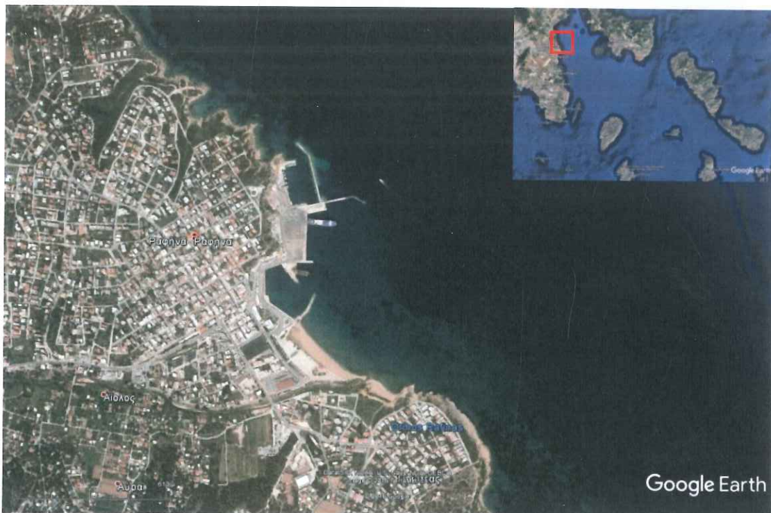
Σχήμα 2.1: Λιμένας Ραφήνας (Υπόβαθρο: Google Earth)

Η Ραφήνα απέχει από την Αθήνα 28 km και από τον Διεθνή Αερολιμένα Αθηνών «Ελευθέριος Βενιζέλος» 10 km. Ο πληθυσμός της υπολογίζεται σε 16.000 μόνιμους κατοίκους, ενώ αυξάνει σημαντικά κατά την καλοκαιρινή περίοδο. Η γεωγραφική της θέση την έχει καταστήσει ένα πολυσύχναστο παραθεριστικό θέρετρο. Θεωρείται από τις σημαντικότερες πόλεις της Ανατολικής Αττικής, αφού συνεχίζει να αποτελεί μόνιμο πόλο έλξης κυρίως για τις όμορφες παραλίες της.