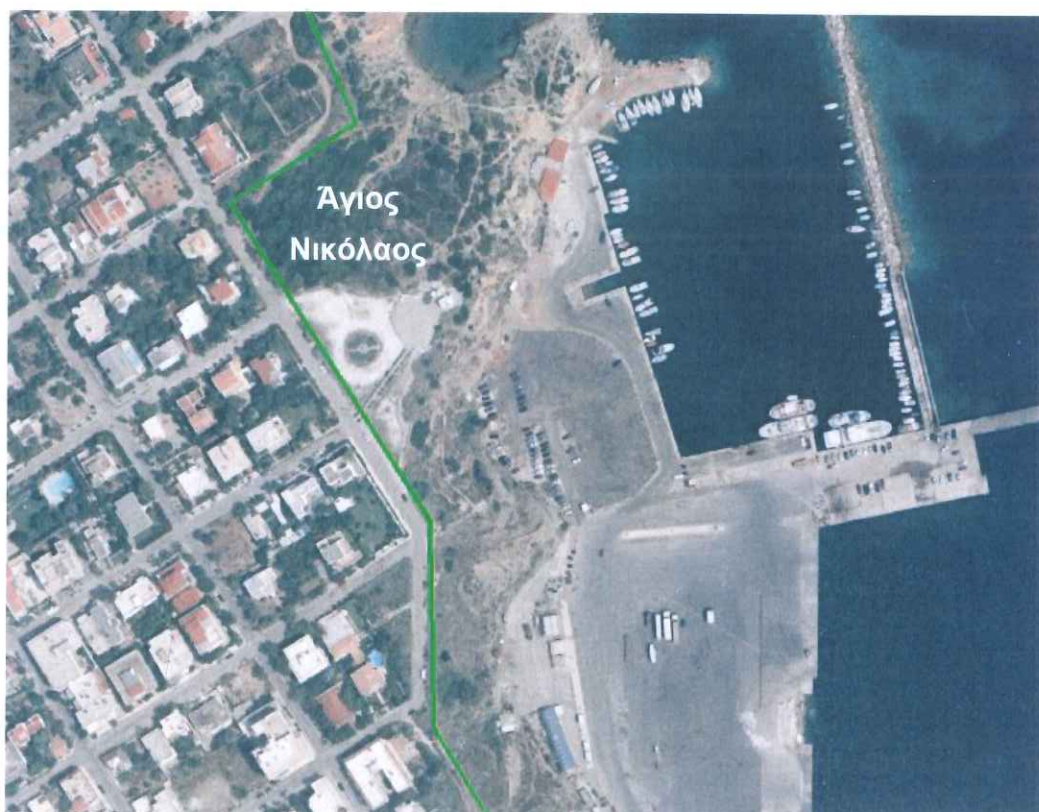
Σχήμα 3.3: Περιοχή «Αγίου Νικολάου» και όριο Χερσαίας Ζώνης Λιμένα Ραφήνας (Υπόβαθρο Ε.Κ.ΧΑ. Α.Ε.)

Πιο συγκεκριμένα, ορίζεται στα δυτικά από την γραμμή της Χερσαίας Ζώνης, η οποία ακολουθεί την γραμμή του διαμορφωμένου πεζοδρομίου, στα βόρεια – βορειοανατολικά από το τοιχίο περιβάλλοντος χώρου εκ σκυροδέματος και πλίνθων και στα νότια - νοτιοανατολικά από τα μεταλλικά κιγκλιδώματα και τα τοιχεία – κράσπεδα, τα οποία διαχωρίζουν τις πλακοστρώσεις από το αδιαμόρφωτο πρανές. Στα ανατολικά, διέρχεται περιμετρικά των κατασκευών μικρών τοιχίων, κρασπέδων, κιγκλιδωμάτων του διαμορφωμένου περιβάλλοντος χώρου των ναϊσκων του Αγίου Νικολάου και της Αγίας Μαρίνας (βλ. Σχήματα 3.1 και 3.3 και συνημμένο Σχέδιο «Τ2 - Τοπογραφικό Διάγραμμα Τροποποίησης Χερσαίας Ζώνης, υπόβαθρο ΕΓΣΑ '87»).