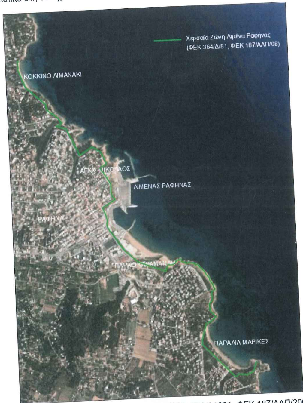
Σχήμα 3.1: Χερσαία Ζώνη Λιμένας Ραφήνας (ΦΕΚ 364/Δ1981, ΦΕΚ 187/ΑΑΠ/2008) – Εξεταζόμενες προς αποχαρκτηρισμό περιοχές

Η Χ.Ζ. Λιμένας Ραφήνας και οι προαναφερθείσες περιοχές που αξιολογούνται στα πλαίσια του παρόντος σε σχέση με τον ενδεχόμενο αποχαρκτηρισμό τους, παρουσιάζονται στο συνημμένο Σχέδιο 1 και στο Σχήμα 3.1 και περιγράφονται αναλυτικά στη συνέχεια.